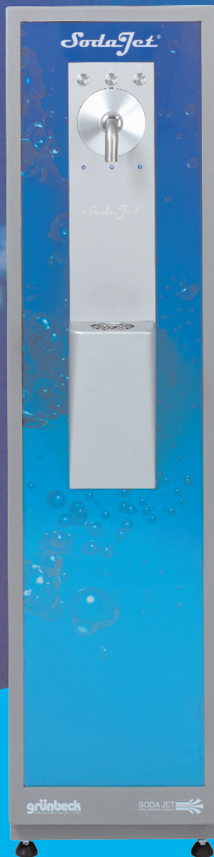
SODA JET® Premium